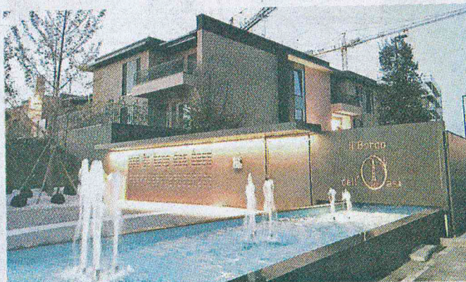
Pronto il primo lotto del Borgo dell'Oasi a Noale

Dunque la città dei Tempesta guarda al futuro, per un quartiere già vivo da metà 2015, da quando inaugurò l'Eurospar e poi, a ruota, s'insediaron attività come Pasticceria Zizzola e gli uffici, tra cui quelli della Cgia di Mestre giunta a inizio settembre. Un po' alla volta stanno per nascere i 51 mila metri cubi e 20 mila di area commerciale previsti dal progetto; secondo le previsioni, altre due palazzine, da 24 appartamenti totali (già venduti 11), saranno consegnate tra un anno, mentre per le altre,